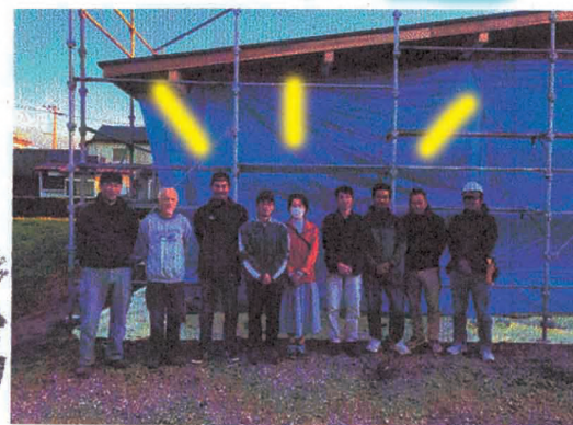
南区 平家 COVACO 棟上げ祝 スキップフロアの家 CAMP 棟上げ祝