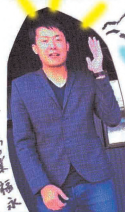
You Tube もご覧下さい!!