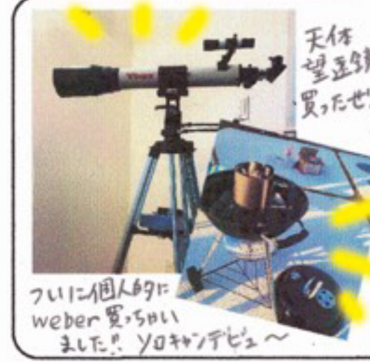
ついに個人が Weber買った ました!! ヨロキデヒュー

年々年初は浴びるようにお酒を飲み、絶対に たりました。元旦はお墓参りと初詣から スタート!! 私はずっと、お墓参りと初詣は大事 早期コロナが流行るまで、お墓参りが楽しく過ご ますように、私も、今年も、少し自身も時間を 使って、お墓参りに行きます!! キャンパス初詣と お墓参りに行きます!! キャンパス初詣と お墓参りに行きます!! キャンパス初詣と