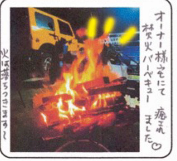
オーナー様を お祝いして、 癒され