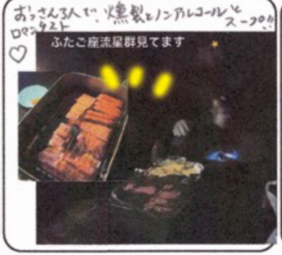
おっさん3人で、燗製とアルコールと ふたご座流星群見ます