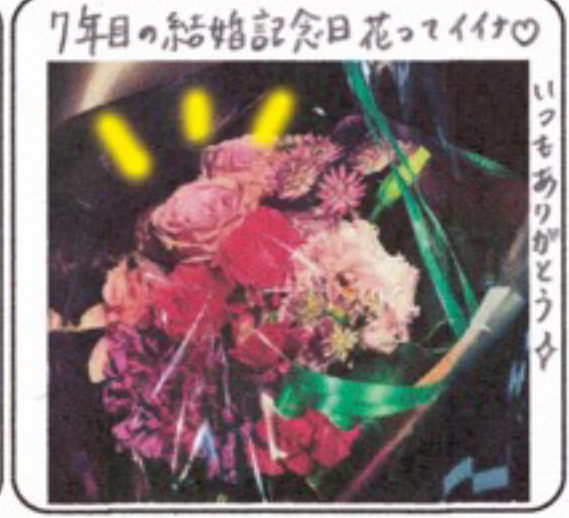
7年目の結婚記念日花ってイイ いつもありがとう